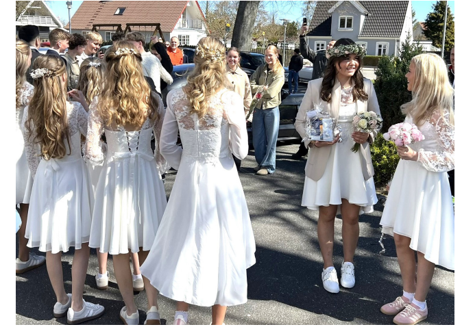
Fine kjoler og sneakers er et hit blandt pigerne i 7.B.

Har du brug for hjælp i forbindelse med tilmelding, er du velkommen til at kontakte kirkekontoret på telefon 98 42 06 93 i åbningstiden.