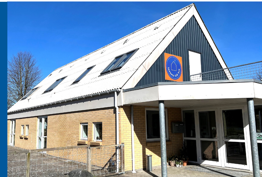
Barnets Blå Hus, Vrangbækvej 115